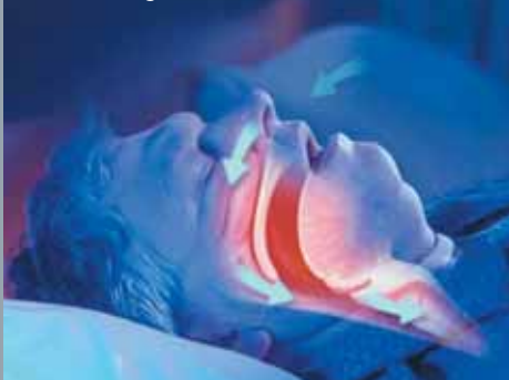
Normal: Ungehinderter Luftfluss